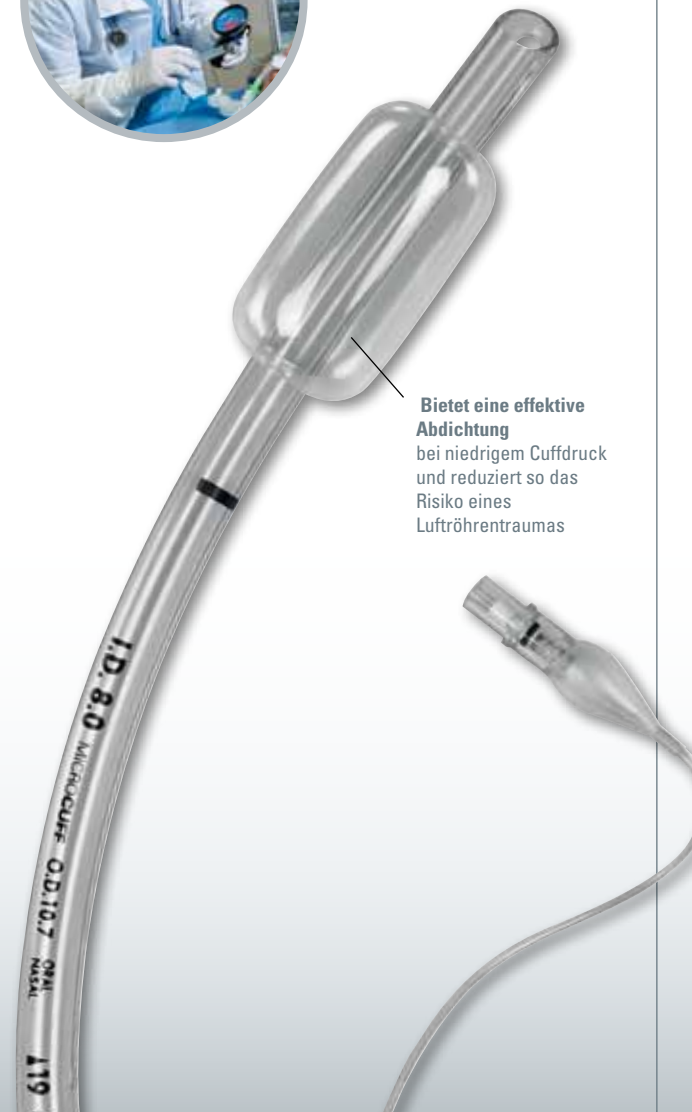
Bietet eine effektive Abdichtung bei niedrigem Cuffdruck und reduziert so das Risiko eines Luftröhrentraumas